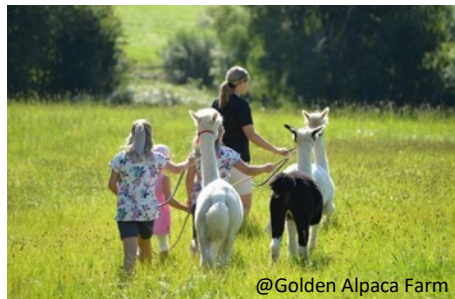
@Golden Alpaca Farm